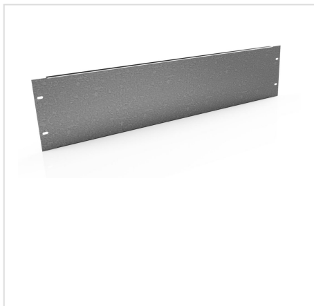
PUA płyta montażowa uniwersalna